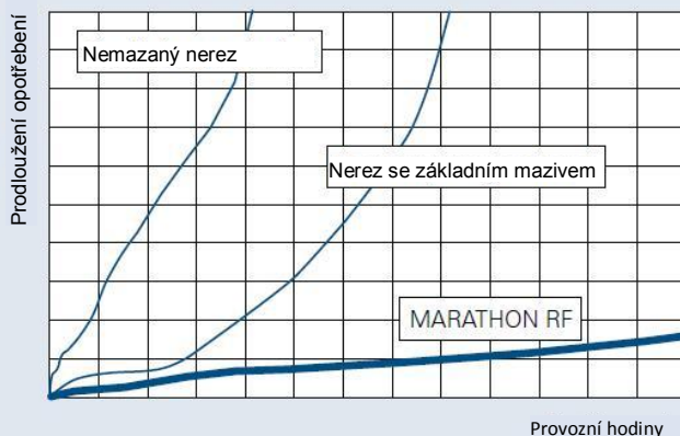
Výsledky dlouhodobého testu opotřebení