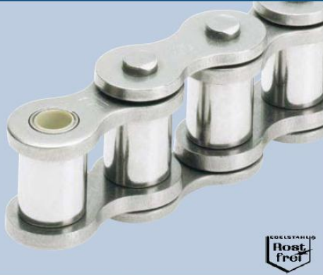
Vysoce zatížitelná polymerová kluzná ložiska TRIGLEIT